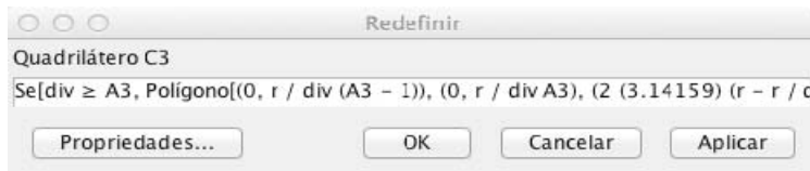
Figura 3: Visão da janela de diálogo onde é definida a fórmula e condição para o desenho do retângulo para cálculo da área aproximada.

igual ao perímetro do círculo correspondente. As células subsequentes da