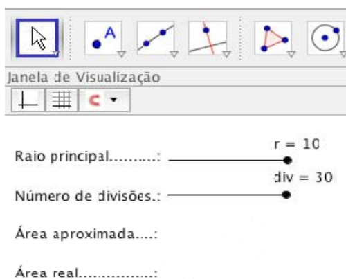
Figura 1: Vista parcial da Janela Gráfica exibindo a região que definirá os dados para desenho e que posteriormente receberão os resultados obtidos

Em tese propõe dividir o círculo em vários anéis concêntricos, que quando abertos são