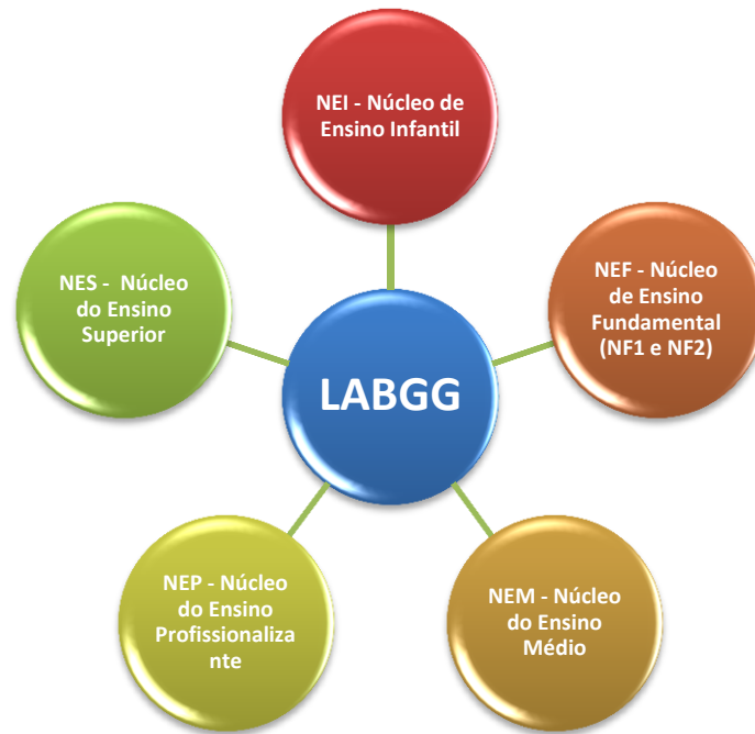
Figura 1 – Organização do LABGG por seus Núcleos.

O funcionamento LABGG tem por finalidade promover o processo de ensino-aprendizagem em matemática e estatística, mediante uma tecnologia educacional na vertente psicopedagógica com vista a fomentar conhecimentos e saberes com foco na álgebra, geometria e estatística. A habilidade de redimensionar conceitos básicos, através da manipulação de software, deve ser alicerçada e construída à medida que se fornece ao aluno os materiais instrucionais de apoio didático, baseados nos elementos concretos representativos do objeto geométrico a serem estudados e aprendidos. Montenegro (2005) referenda este pressuposto declarando que no ensino fundamental e médio, os alunos devem aprender utilizando com modelos sólidos e material visual.