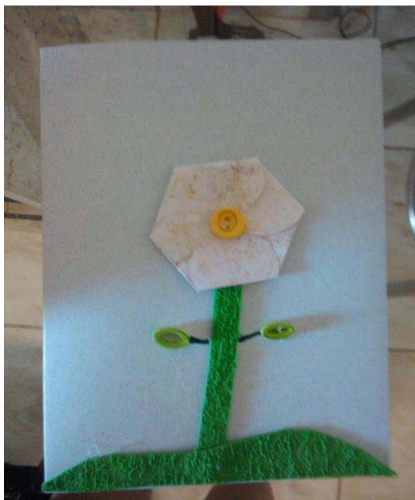
Figura 2 - Flor construída no software, impressa e montada.